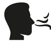
Reuk- en/of smaak- verlies

Heb je op dit moment een huisgenoot met milde klachten en koorts en/of benaauwdheid?